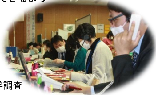
(写真)対策チームによる疫学調査